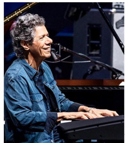
2017: Chick Corea live en Pologne.

Ses plus grands succès ne font pas mystère de ce penchant qui marque toute sa carrière, ce que soit le titre «Spain», devenu un standard, ou son double album «My Spanish Heart» (1976), ouvert par le très remuant «Love Castle». Il y a encore